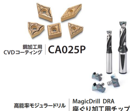
銅加工用 CVDコーティング CA025P